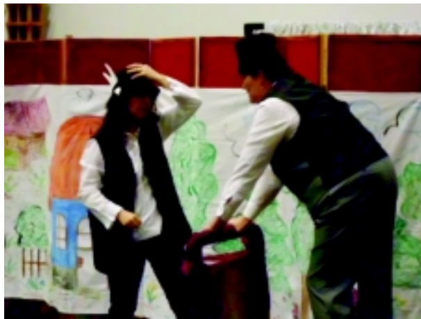
Fazekas Mihály: Ludas Matyi c. előadása

Az őszt méltó lezárása volt 2011. november 12-én az Arany Laci Művészeti Óvoda által rendezett Márton napi