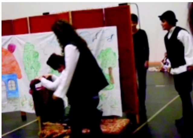
Márton napi hagyományokhoz illő meglepetéssel készültek